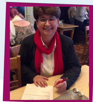
Die stolze Micky bei der Unterschrift zur Zustimmungserklärung als Wahlkreis Kandidatin